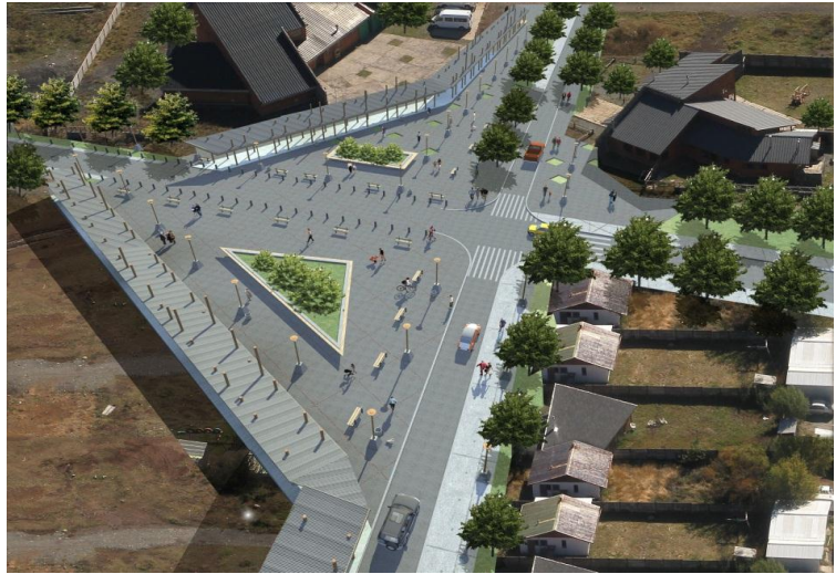
IMAGEN PROYECTO DETONANTE

El proyecto detonante se desarrolla en toda la extensión de la actual calle 9. En su tramo principal (entre plaza y edificio consistorial) se construye un paseo peatonal techado que protege de las inclemencias del clima recorriendo los espacios libres frente a los edificios del municipio, jardín infantil y biblioteca para generar una plazoleta para el intercambio comercial en el encuentro con calle 2 y prolongarse hasta el costado norte de la plaza, uniéndose con el paseo que se proyecta en calle Pedro de Valdivia. El proyecto también generará un acceso al centro deportivo, recreacional y cultural que es parte del PRU y contempla la apertura del tramo final hacia el norte, entre calle 3 y calle 4, esto último para fortalecer la relación del futuro conjunto habitacional con el área central del poblado.