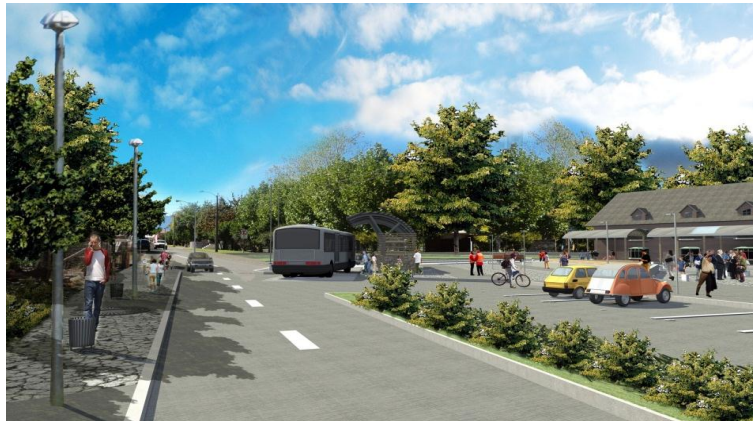
IMAGEN PROYECTO DETONANTE

Los objetivos de la intervención propuesta se relacionan con la implementación de la solución integral, que brinde recintos para la espera y estadía, custodias para los equipajes de los pasajeros de paso (habitantes del campo en visita por el día, visitantes, turistas, mochileros), que incorpora lugares de protección, instalaciones para información y muestras permanentes de artesanías, módulos de intercambio comercial, baños públicos, mobiliario urbano, pavimentos, arborización e iluminación, entre otros elementos. El lugar de acogida al visitante posee características multifuncionales. Se localiza frente a la plaza y a un costado del edificio municipal lo que le permite captar tanto al habitante local que acude por necesidad de servicios, así como al visitante que acude por información.