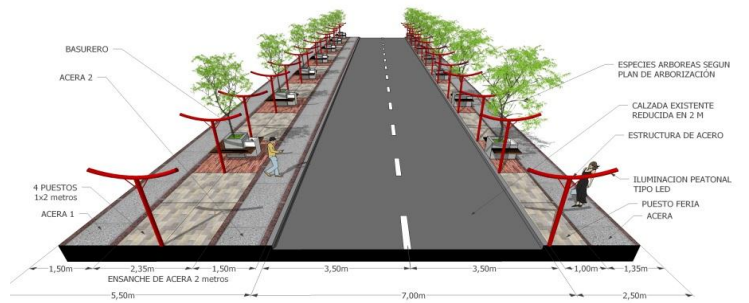
IMAGEN PROYECTO DETONANTE

La calle 7º de línea se reconoce como elemento principal y articulador entre las diversas actividades que en ella se desarrollan, acogiendo al peatón, generando espacios de permanencia, integrando los usos e implementando mobiliarios urbanos acorde al espacio público que se propone mejorar.