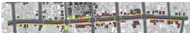
IMAGEN PROYECTO DETONANTE

La Avda. I. Carrera Pinto es la zona de mayor flujo peatonal y vehicular de Los Álamos, además de ser el acceso que recibe a los visitantes y a aquellos que van de paso por la ruta 160. Esta avenida constituye una vía estructurante de la comuna, y se compone de una doble calzada con un importante área de espacio público, consistente en amplias veredas. Estos espacios requieren mejoras que posibiliten el desarrollo de actividades de esparcimiento y circulación, debido al deterioro en los pavimentos de vereda, a la carencia de espacios consolidados y a la falta de mobiliario urbano adecuado.