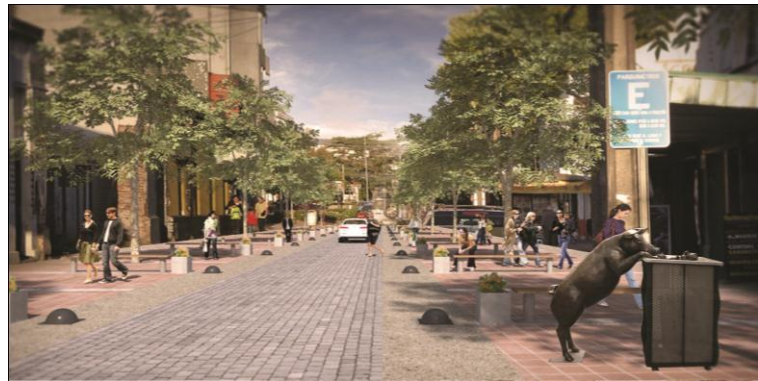
IMAGEN PROYECTO DETONANTE

El proyecto busca dar solución a la comercialización de productos de pequeños productores de hortalizas, a través de una obra de arquitectura que conjuga las actividades propias de una feria y plaza. Tanto la finalidad del proyecto como su ubicación (remate poniente de la Avenida Ricardo Vicuña) son fundamentales en la consolidación de la imagen objetivo propuesta por este Plan, pues potencian la descongestión del centro a través de la generación de nuevos polos de atracción en las áreas más liberadas del centro de la ciudad, a la vez que se refuerza la condición recreativa del sector mediante áreas de paseo y esparcimiento.