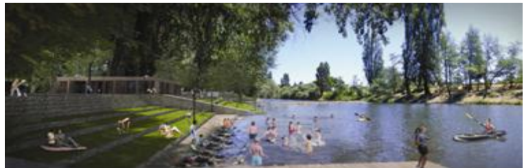
IMAGEN PROYECTO DETONANTE

El proyecto considera retraer el cierre del terreno donde se realiza el rodeo, el cual se encuentra a un costado de Quinta Venecia. Esto se justifica dado que el acceso norte, intersección entre la vía de acceso desde la Ruta 5 con Av. Matta, y punto de concentración de equipamiento deportivo recreacional de carácter provincial, entre ellos Quinta Venecia, el Rodeo, el Estadio y los espacios públicos aledaños, corresponde al acceso más importante a la comuna, el que actualmente presenta un ingreso mezquino a la ciudad. Además, se pretende dar continuidad al parque lateral de la doble avenida de acceso a la ciudad (Av. Matta), con las mismas características que lo identifican en las doce cuadras de longitud que posee; como lo es el acceso norte a la ciudad. El proyecto implica la expansión de la vereda del acceso norte a la comuna y la continuidad del parque y la ciclovía por Avenida Matta hasta Ruta 5, éste no implica modificaciones en la vía; tiene una superficie total de 8.000 mts 2 . Tras la ejecución del proyecto, al terreno se le disminuirán 2.100 mts 2 de frente para ampliar las veredas de Avenida Matta, quedando 5.900 mts 2 de terreno disponible para la mantención de tradiciones culturales, como son los rodeos, carreras a la chilena, la trilla.