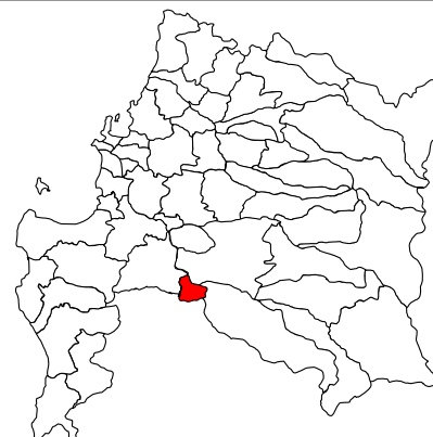
IMAGEN OBJETIVO ÁREA DE INTERVENCIÓN Y CARTERA DE PROYECTOS

REGIÓN BIO BIO PROVINCIA BIO BIO COMUNA NEGRETE LOCALIDAD COIGÜE