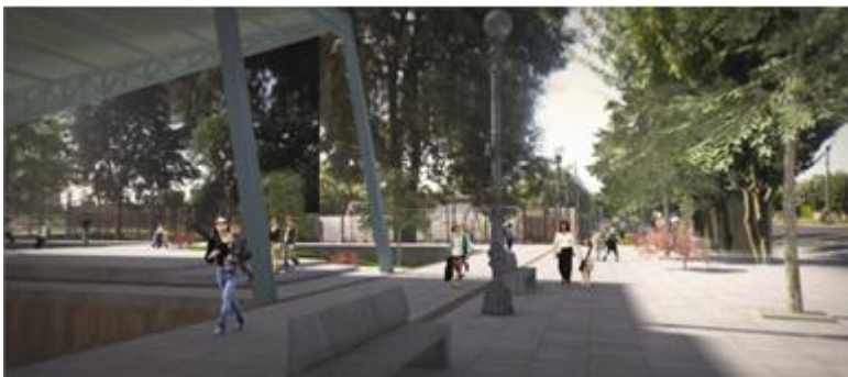
IMAGEN PROYECTO DETONANTE

El desarrollo del centro deportivo y de eventos cubierto, contempla espacios relacionados con la plaza cívica en la que se emplaza, como por ejemplo un escenario, graderías, camarines y servicios para el uso público. Por otra parte se da lugar a instalaciones para eventos deportivos, competencias, y eventos relacionados con actividades y costumbres propias de Coigüe, tal como ferias, carnavales, festividades tradicionales de la localidad, entre otros.