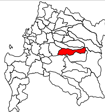
IMAGEN OBJETIVO ÁREA DE INTERVENCIÓN Y CARTERA DE PROYECTOS

REGIÓN BIO BÍO PROVINCIA ÑUBLE COMUNA NINHUE LOCALIDAD NINHUE