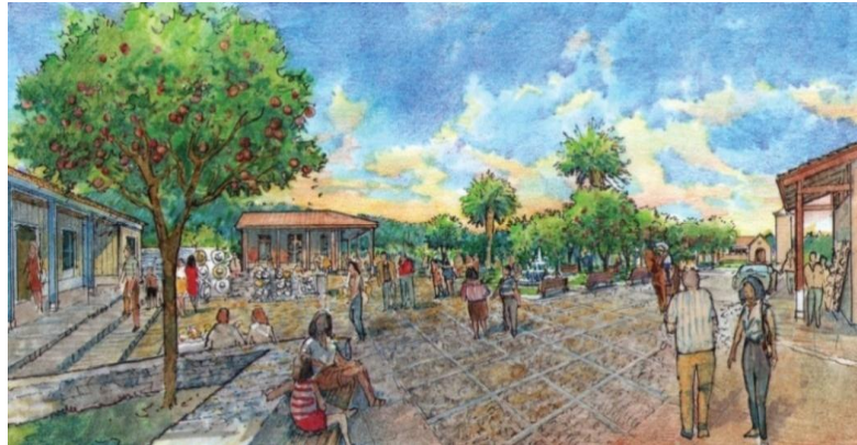
IMAGEN PROYECTO DETONANTE

Con la finalidad de fomentar la valorización del patrimonio y de la cultura de la comuna, con énfasis en sus costumbres y cultura rural, estableciendo un punto de promoción, exhibición y venta de arte y artesanías locales, generando una conexión con su entorno natural y cultural rescatando la presencia del estero en su paso por Ninhue potenciándolo como un espacio público relevante en la comuna. El establecer un sitio permanente de difusión y promoción del turismo local, apoyado en la primera plaza emplazada en el sector fundacional de Ninhue.