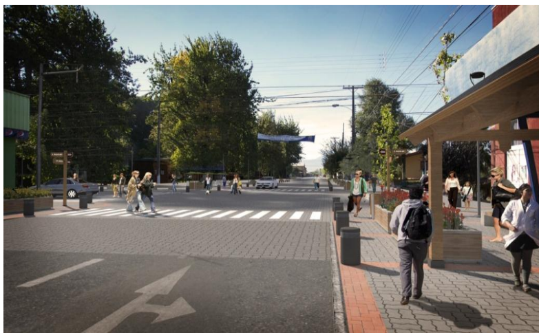
IMAGEN PROYECTO DETONANTE

Promover la relación entre la Plaza y su entorno de equipamientos cívicos, culturales y deportivo recreativo a través del mejoramiento de la plataforma pública transformándola en escenario de actividades sociales atractivas de Pinto.