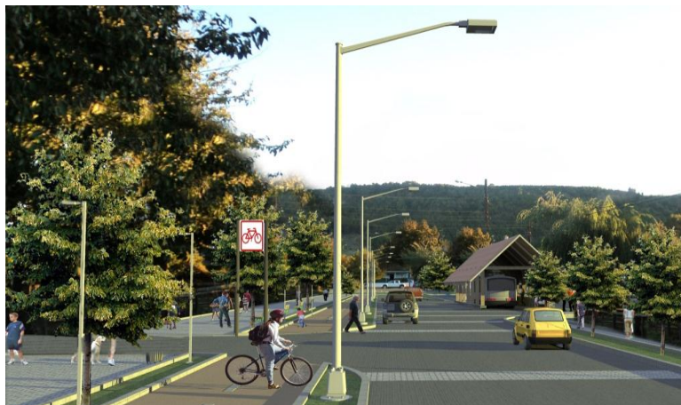
IMAGEN PROYECTO DETONANTE

Las intervenciones propuestas están destinadas a crear un espacio público del cual carece Quilaco, que contribuirá a la estructuración urbana de la localidad, proveyendo de lugares de encuentro para la comunidad y que brinden seguridad y acogida a los visitantes provenientes del entorno rural. Los objetivos de la intervención propuesta se relacionan con la implementación de una solución integral, que incluye una ciclovía, iluminación, arborización y veredas y el mejoramiento de la calzada, junto con redefinir perfiles para dar preferencia al tránsito peatonal.