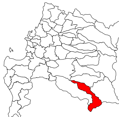
IMAGEN OBJETIVO ÁREA DE INTERVENCIÓN Y CARTERA DE PROYECTOS

REGIÓN BIO BIO PROVINCIA BIO BIO COMUNA QUILACO LOCALIDAD QUILACO