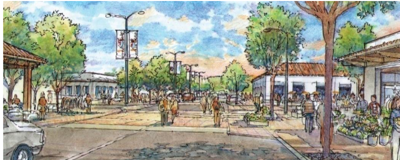
IMAGEN PROYECTO DETONANTE

Como estrategia de desarrollo para la localidad surge la necesidad de una estructuración adecuada al sector poniente que permita fortalecer las áreas productivas de comercio y de recreación, en las cuales se potencie el desarrollo de la comuna. Dentro de esta idea cabe destacar la intervención propuesta para validar el espacio más significativo de la localidad logrando potenciar una imagen urbana que representa la identidad de cada habitante de Quirihue.