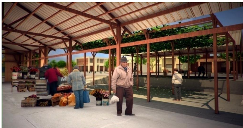
IMAGEN PROYECTO DETONANTE

La antigua estación de trenes y el espacio de la faja vía generan un vacío en el sector antiguo de la localidad, y a pesar de que ya no opera el ferrocarril se mantiene como lugar central, dadas las actividades comerciales que se generan en la calle Nicasio Alarcón. El proyecto detonante se plantea en esta calle principal, entre las calles Castellón y O' Higgins, y en predio que el municipio adquirió, en torno a lo que fue la bodega de ferrocarriles, y que forma parte del sector estación. El espacio público que se propone enfrenta al Centro Cultural, colinda hacia el poniente con una futura Área Verde y está localizado a una cuadra del municipio.