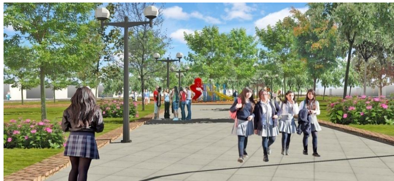
IMAGEN PROYECTO DETONANTE

Este Proyecto propone intervenir este lugar obteniendo un mejoramiento íntegro y eficaz, el que será capaz de atraer a los habitantes de esta parte de la comuna. Con ello se elevara el estándar de la calidad de los espacios públicos de este sector y de la comuna, lo se transformará en un referente comunal a seguir.