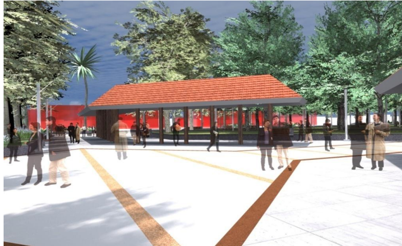
IMAGEN PROYECTO DETONANTE

La necesidad de potenciar el uso del espacio público y fomentar las actividades masivas comunales. El proyecto consiste en remodelar la plaza de armas de la comuna manteniendo la estructura funcional y espacial, implementando un espacio Feria techado de uso público y libre tránsito peatonal.