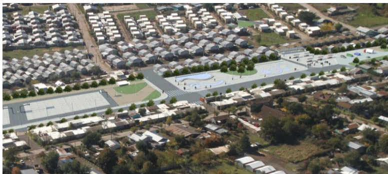
IMAGEN PROYECTO DETONANTE

La intervención propuesta se relacionan con la implementación de una solución integral, que incorpora módulos de intercambio comercial, mobiliario urbano, pavimentos, arborización e iluminación, entre otros elementos. Se postula su ubicación en el sector de la ex estación de trenes de Santa Bárbara, donde se genera un espacio baldío de propiedad municipal, que se usa parcialmente como feria informal. Se plantea la recuperación de ese terreno deteriorado, incorporándolo a la ciudad, en un sector donde se da la mayor densidad habitacional y en la dirección de la tendencia de crecimiento. Contribuirá a aquello la creación de un espacio público semicubierto destinado al intercambio comercial y recreativo, que articule las actividades urbanas y rurales. El espacio para feria de productos, se complementará con áreas deportivas, áreas recreacionales y juegos de agua.