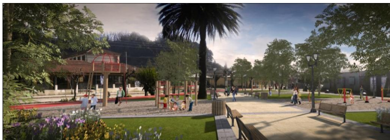
IMAGEN PROYECTO DETONANTE

La iniciativa contempla la intervención en pavimentos creando una plataforma peatonal y vehicular, iluminación, arborización, instalación de mobiliario urbano y las instalaciones necesarias para su habilitación.