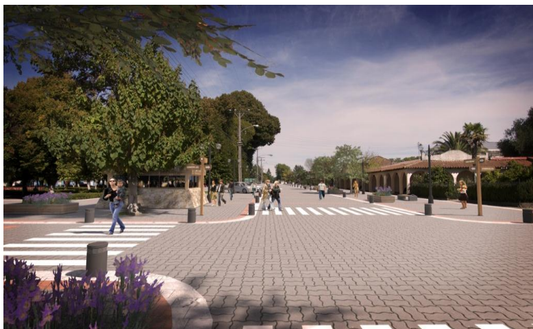
IMAGEN PROYECTO DETONANTE

La localidad de Tucapel posee atributos patrimoniales-turísticos. Para potenciar este rol se propone valorizar la plaza y mejorar la plataforma pública en torno a las calles Esmeralda, Bulnes, la calle del Cementerio y Rústico Molina; eje a través del cual se articulan los siguientes equipamientos: escuela, plaza, estadio y cementerio. El proyecto contempla el diseño y construcción del mejoramiento del entorno de la plaza y calles señaladas, con especial tratamiento frente a edificios de valor patrimonial